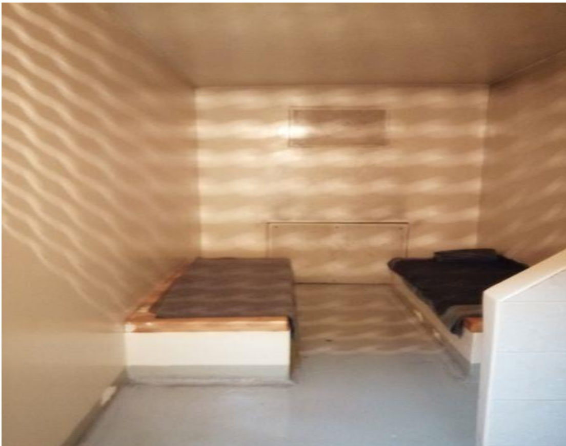
Просторија за задржавање у СПИ Чачак

У просторијама се налазе грејна тела – радијатори, који су уграђени у зид и обезбеђени решеткама.