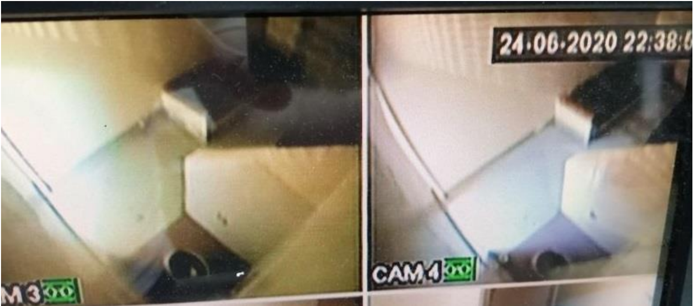
Положај камера у просторијама за задржавање СПИ Чачак