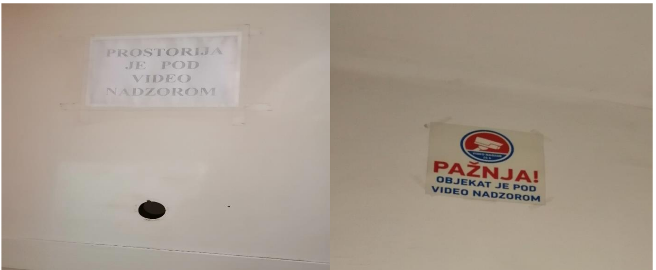
Напис да је просторија под видео надзором на вратима и на зиду саме просторије

У просторији не постоји дугме за позивање страже. Постоји видео надзор, што је јасно обележено на улазним вратима у просторију и у самој просторији. Видео запис се чува до 15 дана због малог капацитета хард диска.