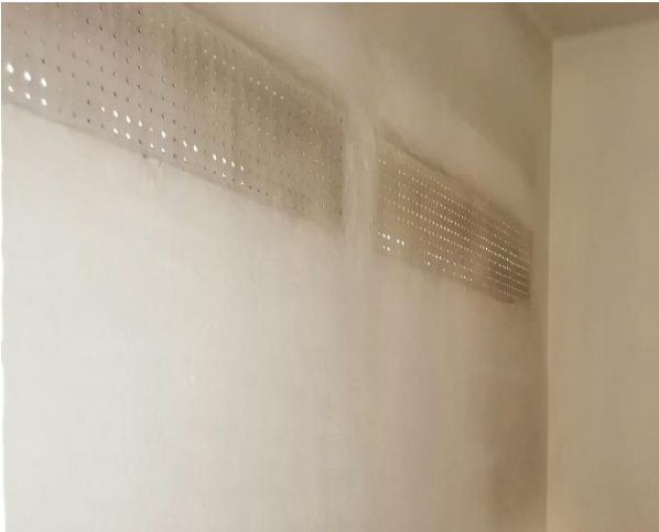
Решетка на прозору у ПС Горњи Милановац

Осветљење у просторији како природним, тако и вештачким светлом је недовољно јер иако постоји спољашњи прозор и отвор у зиду изнад врата са сијалицом, оба су прекривена рупичастом решетком. Прозор се не отвара. Грејање просторије зими је до 22,00 часа. Све инсталације (светло, прозор, радијатор) су прекривене решетком, тако да нема истурених делова који би могли представљати опасност од самоповређивања.