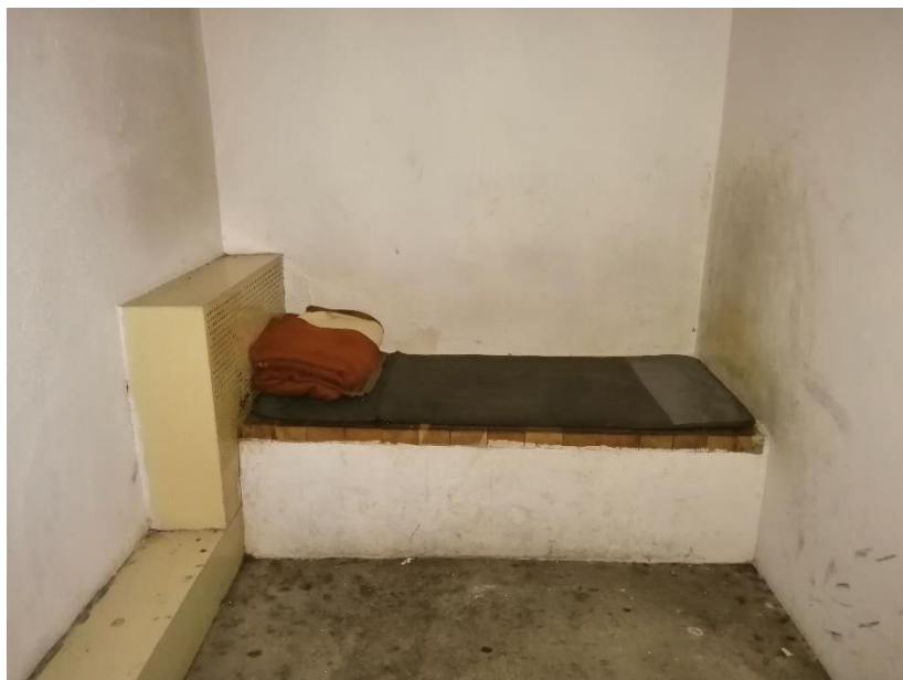
Лежај у просторији за задржавање лица у ПС Горњи Милановац

У ПС Горњи Милановац постоји једна просторија за задржавање за смештај једног лица, укупних димензија око 10м 2 . Лежај чини бетонска основа, подлога од укованих дасака и танак душек, без постељине, осим два ћебета. У просторији не постоји мокри чвор, већ се лица спроводе до тоалета за запослене на истом спрату на ком се налази и просторија. У просторији се не осећа непријатан мирис.