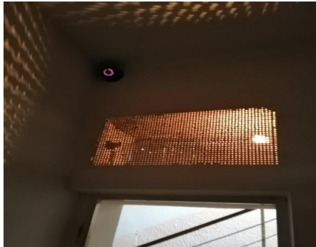
Отвор изнад врата - решетка са сијалицом